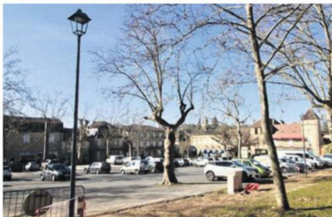
La place Hugues Salel pourvue de ses nouveaux lampadaires basse consommation